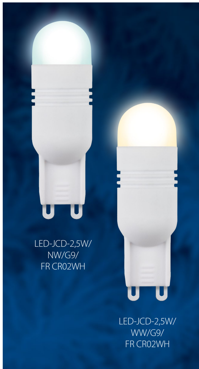
LED-JCD-2,5W/ NW/G9/ FR CR02WH

Светодиодные лампы сетевого напряжения LED-JCD